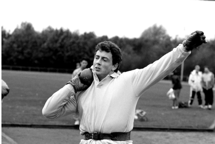
Erik de Bruin in Roermond tijdens de werpwedstrijd in 1990.

Al vanaf 1978 organiseert Swift in het laatste weekend van het wedstrijdseizoen een afsluitende wedstrijd. In de eerste jaren worden er nog allerlei onderdelen afgewerkt maar later louter en alleen werpnummers. Er is niet te achterhalen wanneer deze werptraditie is ontstaan. Wel verschijnen er altijd topatleten op deze wedstrijd. Zo is in 1990 Erik de Bruin een van de deelnemers. In dat jaar wint hij het kogelstoten met een afstand van 19,73 meter. De kogelstootbak van 20 meter is maar net groot genoeg. De jury beleeft spannende momenten want wat te doen als hij over de bak heen stoot? Het gaat allemaal net goed en Erik levert met deze stoot de beste Nederlandse jaarprestatie.